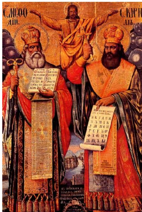
Ikona zobrazující sv. Cyrila a Metoděje http://cs.wikipedia.org/wiki/Cytil_a_Metod%C4%9Bj

5. Když odešli do Říma, aby jejich práci schválil papež, jeden z bratří onemocněl. Kdo to byl a co se stalo dále?