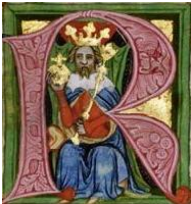
Václav II. na miniatuře ve Zbraslavské kronice http://cs.wikipedia.org/wiki/V%C3%A1clav_II.