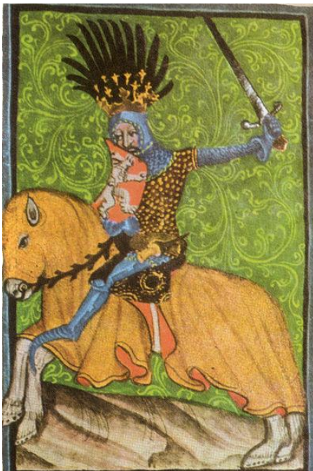
Jezdecký portrét krále Jana v Gelnhausenově kodexu http://cs.wikipedia.org/wiki/Jan_Lucembursk%C3%BD

Co jim chránilo hlavu? Čím se od sebe odlišovali?